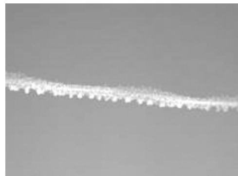
3. Bild: Sich ausbreitender Dauerstreifen

Weil sich Kondensstreifen in sehr hohen Lagen bilden, wo üblicherweise sehr starke Winde wehen, bewegen sie sich fort und verlassen ihre Herkunftsgebiete.