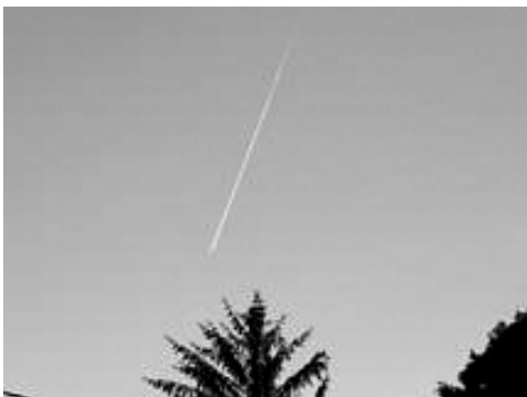
1. Bild: Kurzlebiger Kondensstreifen