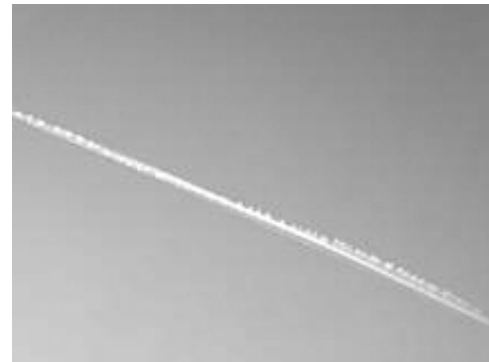
2. Bild: Sich nicht ausbreitender Dauerstreifen (Bild der NASA)