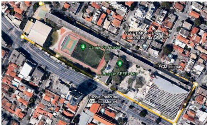
Figura 2- Imagem de satélite do Campus Nova Suíça - CEFET MG.