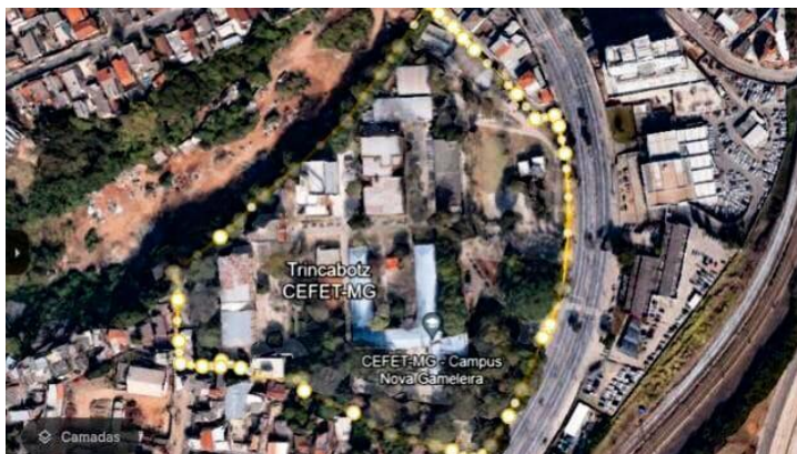
Figura 3- Imagem de satélite do Campus Nova Gameleira - CEFET MG.

Comentado [1]: Na determinação dessa área, considerar: - A orientação da imagem, que está com o Norte voltado para o Sul. - Traçar o polígono corretamente, pois há uma leve curvatura na área do campus I que começa próximo do campo de futebol.