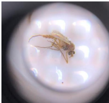
Figura 7- Mosquito da espécie Culex quinquefasciatus .

A espécie Culex quinquefasciatus é popularmente conhecida como “pernilongo”, e sua captura foi a única registrada na primeira coleta (realizada no dia 11/08/2023) no Campus I. (Figura 7)