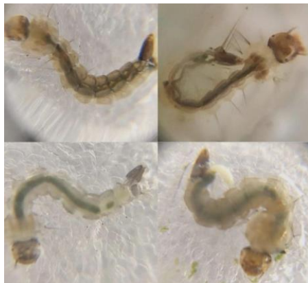
Figura 9- Larvas da espécie Aedes aegypti .

A espécie Aedes aegypti , foco do estudo, foi encontrada apenas em outubro, em 1 capturador, e novembro, em 2. No primeiro mês de incidência estava localizado no Campus I e no segundo em ambos os campi.