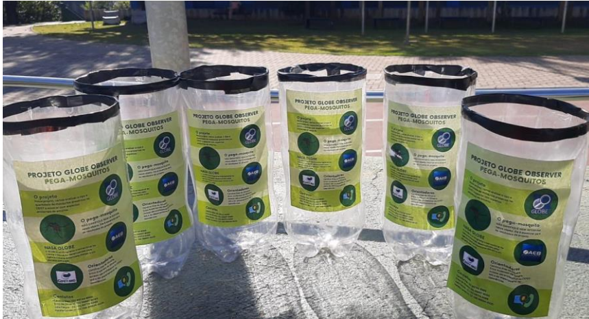
Figura 5- Capturadores com etiquetas identificadoras.