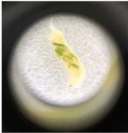
Figura 8- Larva da espécie Megaselia cf. imitatrix .

A espécie Megaselia cf. imitatrix é correspondente a pequenas moscas. Suas larvas foram tidas como as mais incidentes, encontradas nas coletas de setembro a dezembro. (Figura 8).