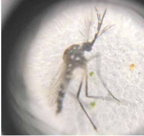
Figura 10- Mosquito da espécie Aedes aegypti .