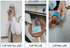
فيمس ثمرجة حلاوة الثمرة | فيمس قننة الثمرة | فيمس محيط الثمرة

2- ثمار اكثر و ذات جودة افضل (من حيث الحجم والكتلة ودرجة الحلاوة) للمنطقة 1 مقارنة بالمنطقة 2