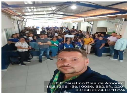
Dia 5 de maio combate à exploração e abuso sexual infantil.

E.E Faustino Dias de Amorim -15,81396, -56,10086, 532,8ft, 220° 03/04/2024 07:18:24