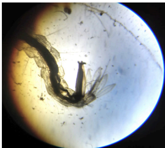
Figura 04: Sifão de uma larva de mosquito Aedes Aegypti

Conclui-se que o pH analisado da água apresentou caráter alcalino 7,56, segundo o estudo de Diesel (1992) em suas análises concluiu que, o pH 7,2 apresenta um resultado propício no desenvolvimento de larvas do mosquito Aedes Aegypti . A turbidez da água foi de 475 NTU em função da matéria orgânica. Segundo NEVES et. al. (2016), as larvas se alimentam da matéria orgânica disponível, o que pode justificar a presença das larvas. A condutividade da água é uma medida da capacidade da água de conduzir eletricidade, a amostra tem um grande valor de íons dissolvidos provavelmente em função da matéria orgânica. A temperatura da água 24,8 °C e ambiente 28°C que segundo Beserra et. al. (2009) a temperatura favorável ao vetor encontra-se acima dos 22°C e abaixo dos 32°C.