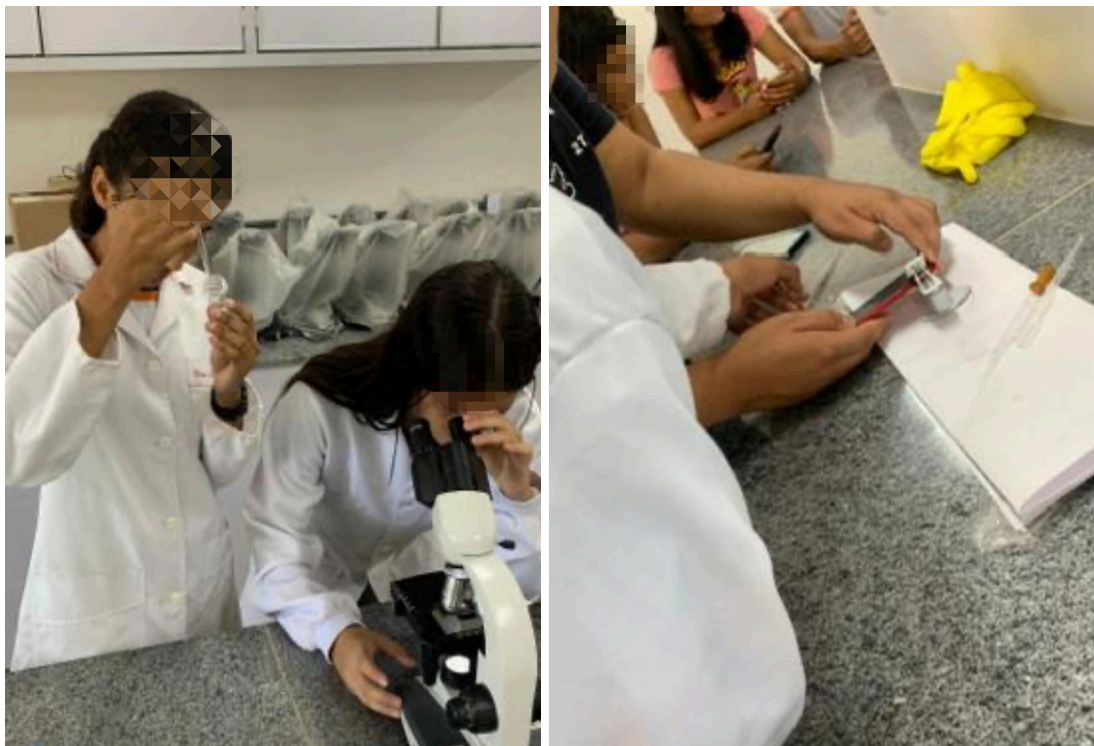
Figura 03: Fotos dos alunos na UFMA realizando análise dos parâmetros físico-químico da água dos focos de mosquitos coletados no Parque Centenário.