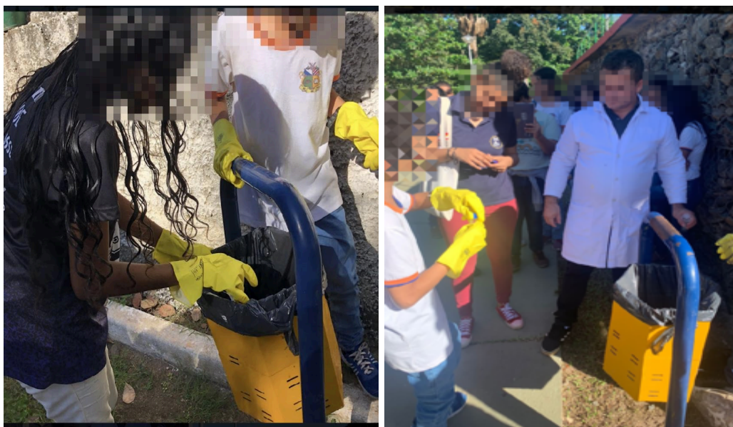
Figura 02: Fotos dos alunos e professores realizando a coleta nas lixeiras do Parque Centenário.

Na primeira etapa foi executada a identificação de possíveis focos do mosquito Aedes aegypti . Os locais escolhidos foram lixeiras distribuídas em vários pontos num perímetro de 1600 metros. É um local com 35 lixeiras e não havia chovido desde o dia 14 de maio de 2023. A coleta ocorreu no dia 23 de maio, pela manhã, às 8h44min22s, na Figura 02 são apresentadas fotos tiradas do local no dia da coleta. Algumas lixeiras estavam protegidas da insolação do período de 6h às 18h, ficando expostas ao sol por menos de 5 horas nesse período.